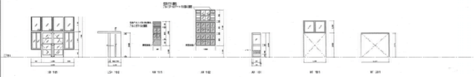
府立鴨沂高等学校新校舎図面