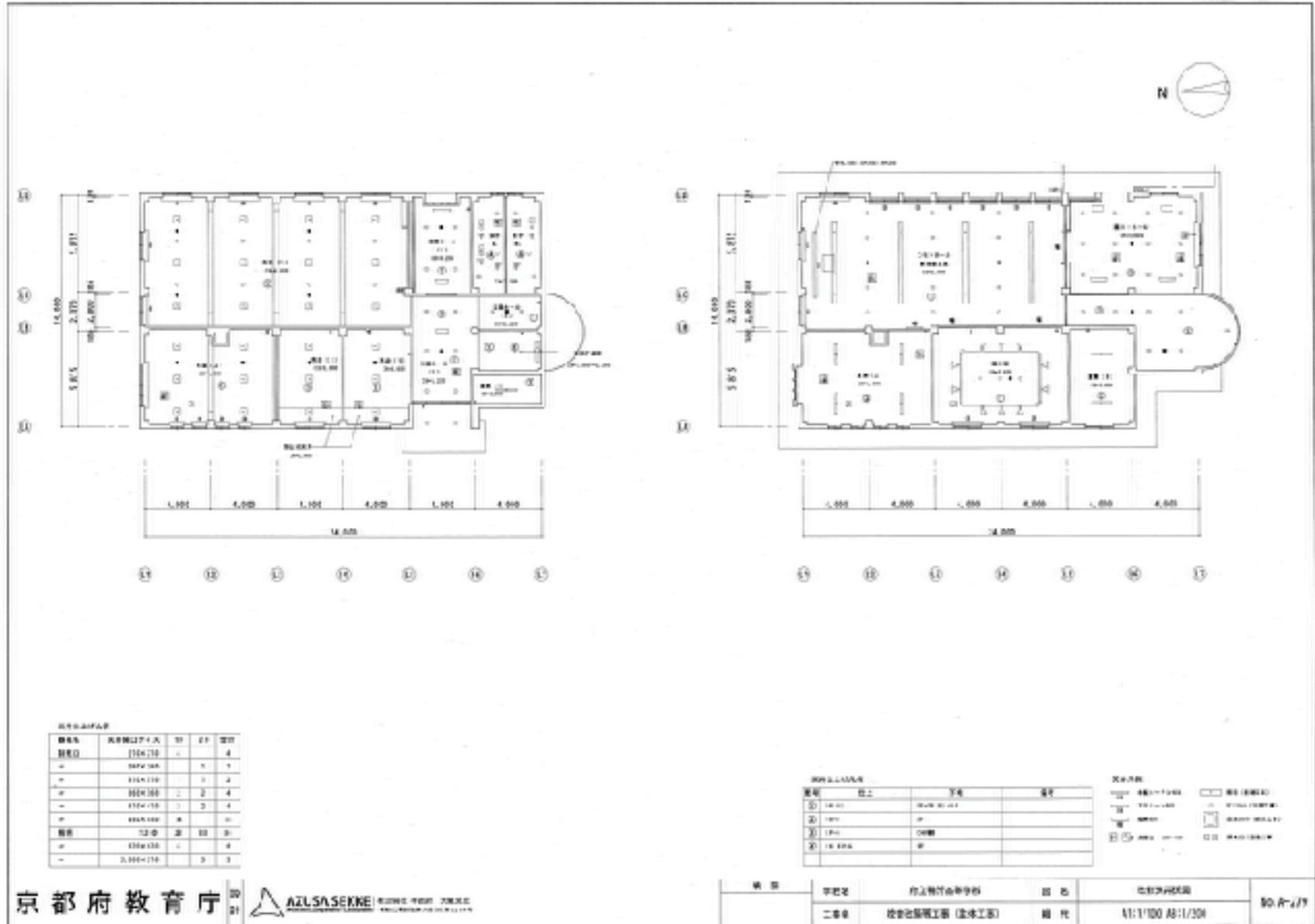
府立鴨沂高等学校新校舎図面